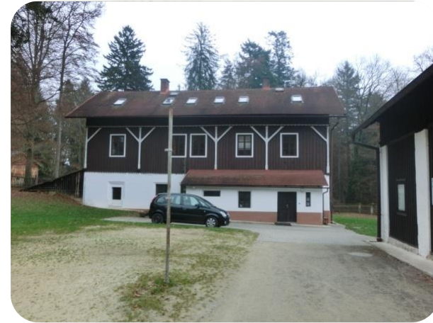
hlavní a vedlejší budova